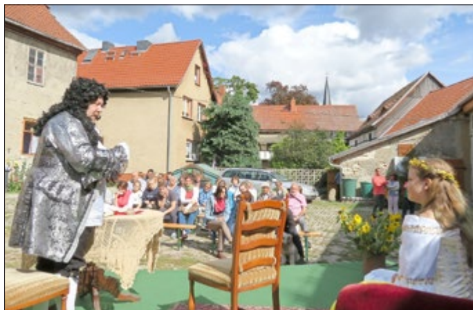
Theater im Hof des Tante Irma Museums

Mehr über das Programm des Tante Irma Museums finden Sie auf der Webseite www.tim-hummelshain.de oder können es erfragen unter 015256879301.